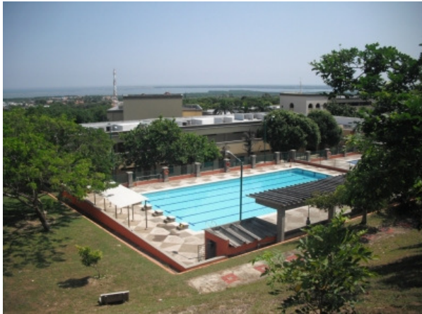
Die Schule mit Pool