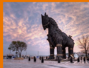
Warum nennt man eine PC-Schadsoftware „Trojaner“?

Aktuell ist sehr viel von „den Wurzeln unserer Kultur“ die Rede. Vieles von dem, was wir heute selbstverständlich zu unserem Gedankengut und unseren Werten zählen, hat seinen Ursprung in der Antike, bei den Griechen und Römern. Im Lateinunterricht lernt man diese Ursprünge kennen, viel intensiver als in anderen Fächern.